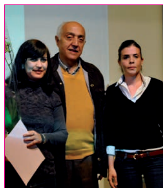
Acte inaugural de les Jornades de la Dona

Altres actes de les jornades són: dia 6, conferència: "Ser mujer en tiempo de crisis" a càrrec de Pilar Alama. Dimecres dia 7, projecció pedagògica i cine-fórum i sopar de les Dones Progressistes. Dia 8, Missa a l'Església de Sant Pere; dinar de les Ames de casa Tyrius i, participació en la manifestació de València. Divendres dia 9, acte de Cloenda de les Jornades; Lectura dramatitzada de textos sobre la dona, pels alumnes de l'EMT de Massanassa; i Ball de danses valencianes pel grup de ball "Gent Gran" de Massanassa.