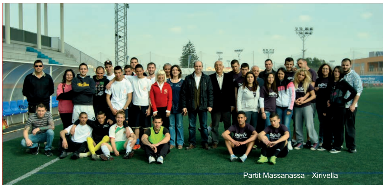
Partit Massanassa - Xirivella