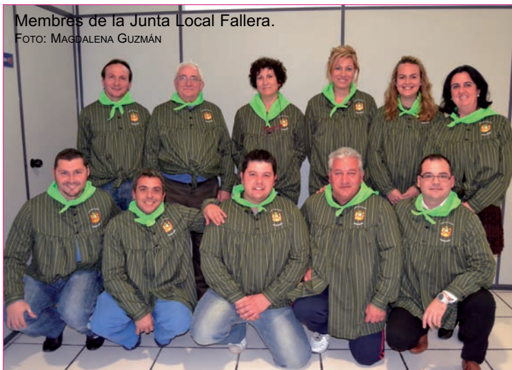
Membres de la Junta Local Fallera.